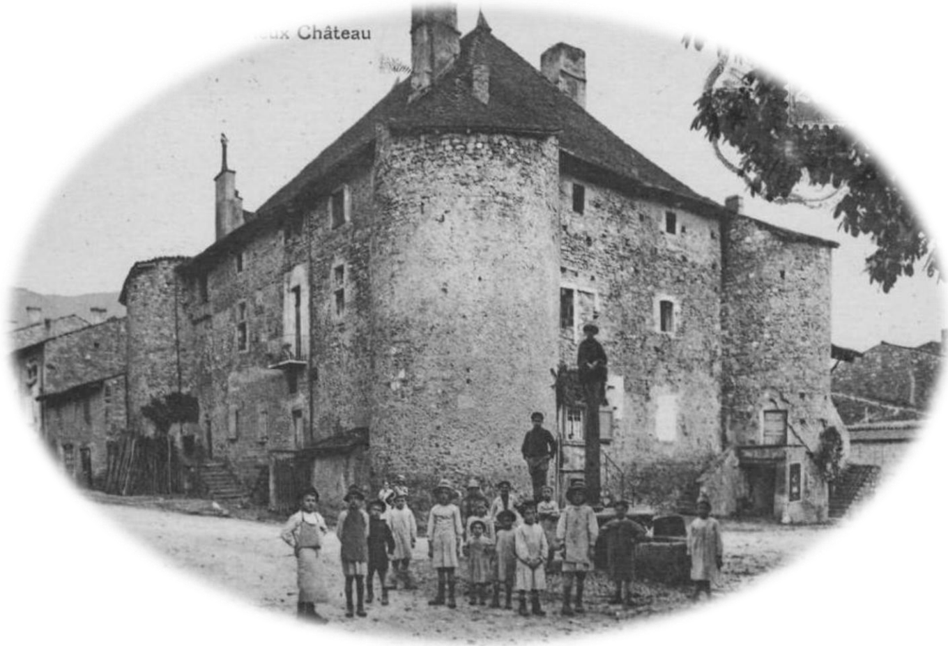
CHÂTEAU MONTFERRAND DE LAGNIEU